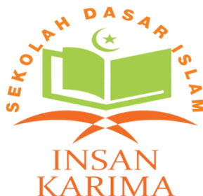
(Logo SD Islam Insan Karima)