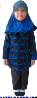
BATIK BADUY (PUTRI)