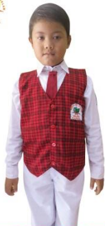
PUTIH PUTIH + ROMPI (PUTRA)