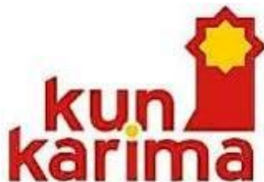
(Logo Yayasan Kun Karima)

Yayasan Kun Karima atau biasa disebut dengan Kun Karima Foundation merupakan lembaga pendidikan islam yang menaungi beberapa jenjang pendidikan yaitu Kelompok Bermain (Kober), Taman Kanak-kanak (TK) Islam dan Sekolah Dasar (SD) Islam yang semuanya bernama Insan Karima. Berdirinya Kober, TK dan SD Islam Insan Karima Rangkasbitung adalah pengembangan dari TK Islam Insan Karima yang ada di Kabupaten Pandeglang yang lebih dulu berdiri yakni pada tahun 2007 yang merupakan realisasi cita-cita dari Yayasan Kun Karima untuk ikut berpartisipasi dalam mencerdaskan kehidupan bangsa.