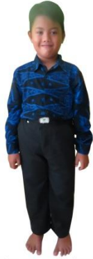
BATIK BADUY (PUTRA)