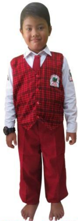
PUTIH MERAH + ROMPI (PUTRA)