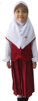
PUTIH MERAH + ROMPI (PUTRI)