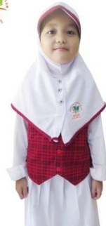
PUTIH PUTIH + ROMPI (PUTRI)