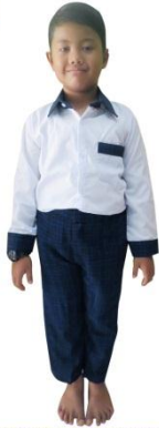
PUTIH BIRU (PUTRA)