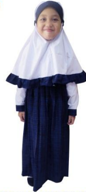
PUTIH BIRU (PUTRI)